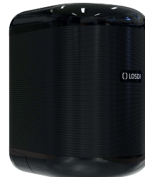
REF: CP-3010-BL Acabado NEGRO