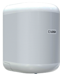
REF: CP-3010-B Acabado BLANCO