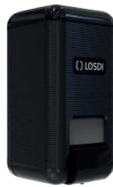
REF: CJ-3003-BL Acabado NEGRO