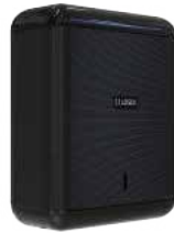
REF: CP-3009-BL Acabado NEGRO