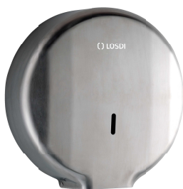
REF: CO-0207-S Acabado SATINADO