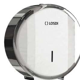
REF: CO-0207-I Acabado BRILLO