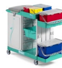
Magic System 720P