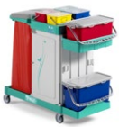
Magic System 720S