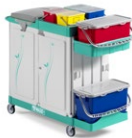
Magic System 720E