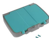
Tapa doble fondo para soporte de bolsa 120 L