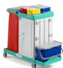
Magic System 710S