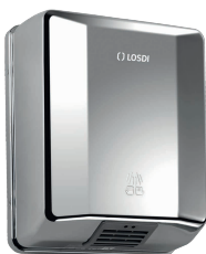
REF: CS-400-X Acabado CROMADO