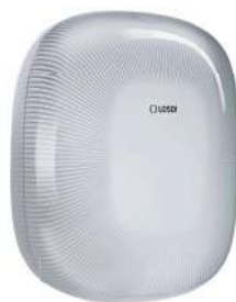
REF: CP-5009-B Acabado BLANCO