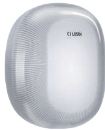
REF: CP-5010-B Acabado BLANCO