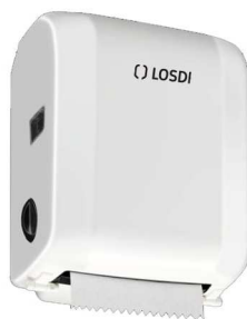
REF: CP-0525-B Acabado BLANCO